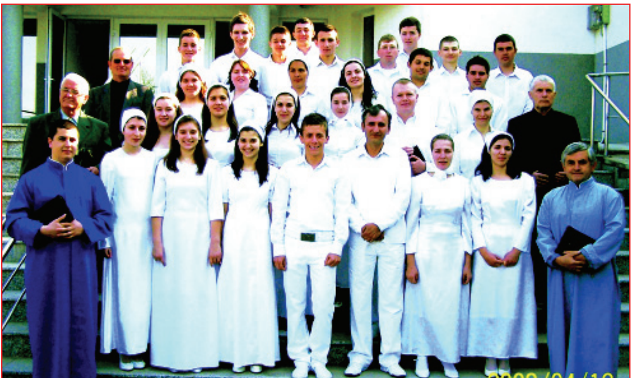
Botez noutestamental la Biserica Penticostală „Efrata” din Făget, județul Timiș, când 28 de suflete au încheiat legământ cu Domnul în luna aprilie a anului 2009